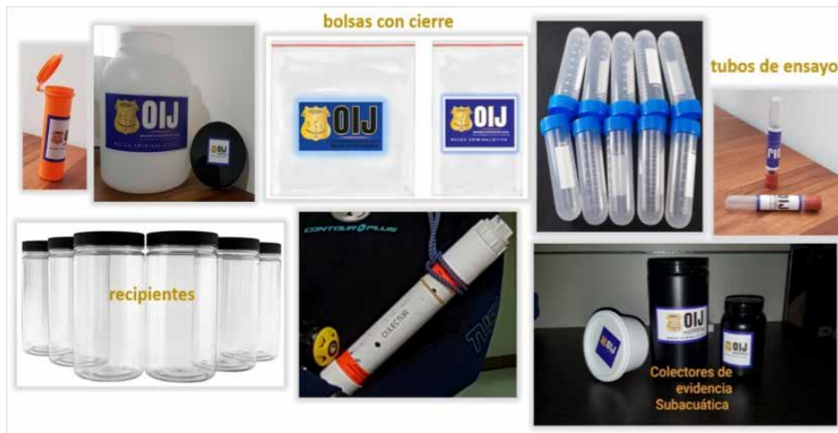
Imagen N° 4 Colectores de evidencia subacuática en diferentes materiales y tamaños