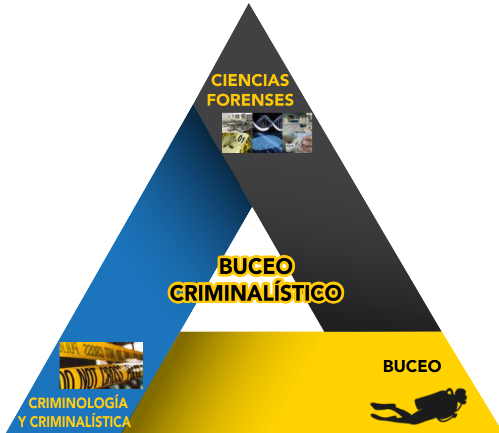
Ilustración 2. Elementos que son parte del Buceo Criminalístico