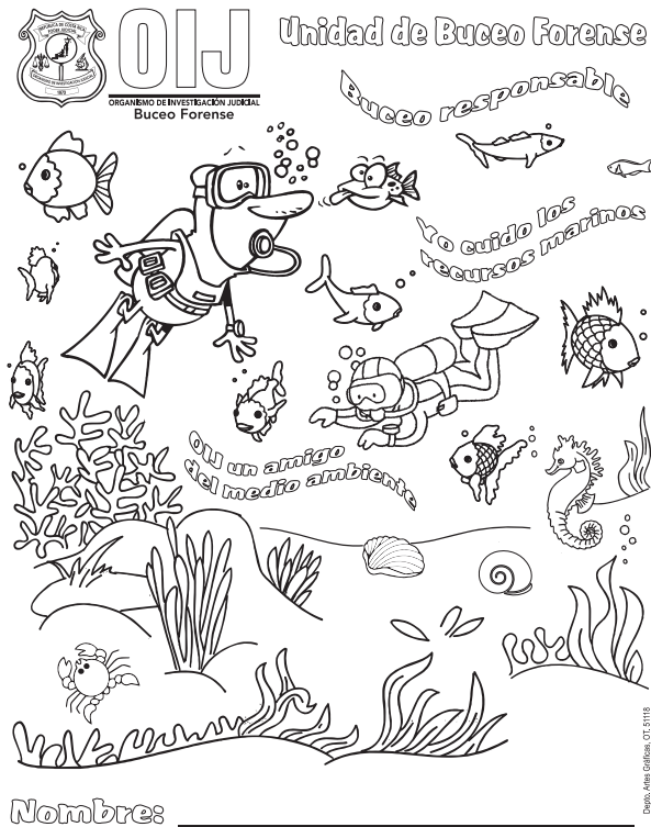
Imagen 2. Hola de colorear utilizada en las actividades con personas menores de edad, para generar conciencia ambiental.

En el caso de Costa Rica ya se ha avanzado en este sentido, veamos: