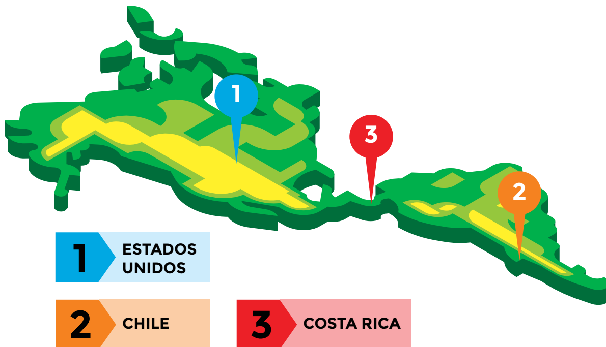
Situación actual en algunos países referentes de América en materia de buceo Criminalístico