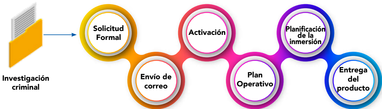
Ilustración N° 4. Esquema Procedimiento de Solicitud de la Unidad de Buceo del OIJ

La activación de la Unidad de Buceo Criminalístico del OIJ se realiza de la siguiente manera: